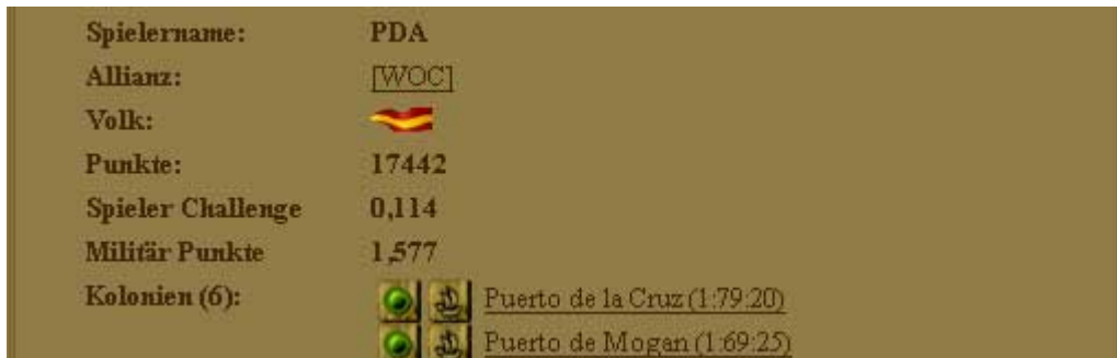
Abbildung 2: Spieler und Challenge Punkte