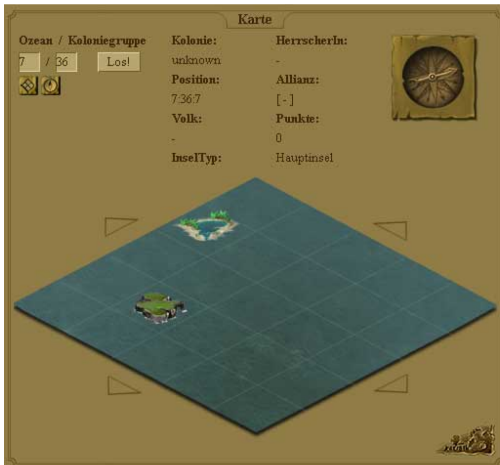
Abbildung 1: Die Karte

Die Anmeldung ist kostenlos und kann unter „Registrieren“ auf http://www.piratenkriege.de vorgenommen werden. Unter Spiele kann man sich in die einzelnen Servern einloggen. Dazu muss man sich erst - neben der Accountregistrierung - auf den Servern registrieren. Dazu klickt man unter „Verfügbare Spiele“ einfach auf die zugehörige „Jetzt anmelden“. Danach erscheint der registrierte Server unter „Registrierte Spiele“. Jetzt muss man nur noch auf „Zum Spiel“ klicken.